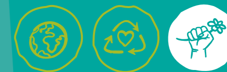
Global engagieren Müll vermeiden Klima- und Umweltschutz