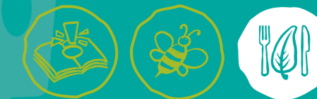
Umweltwissen sammeln Artenvielfalt-Tiere schützen Nachhaltige Ernährung