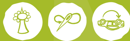
Städtisch Gärtnern Nähwerkstatt, Repair Cafés & Co Verkehr neu denken