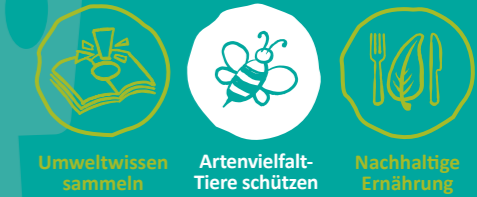
Umweltwissen sammeln Artenvielfalt-Tiere schützen Nachhaltige Ernährung