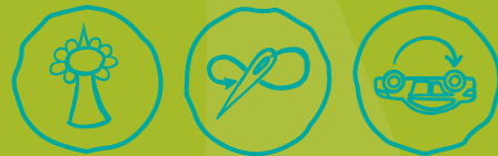
Städtisch Gärtnern Näherwerkstatt, Repair Cafés & Co Verkehr neu denken