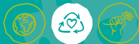
Global engagieren Müll vermeiden Klima- und Umweltschutz

MINDESTALTER DER FREIWILLIGEN: ab 18 Jahren