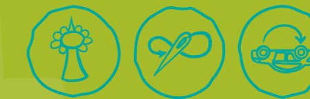
Städtisch Gärtnern Näherwerkstatt, Repair Cafés & Co Verkehr neu denken