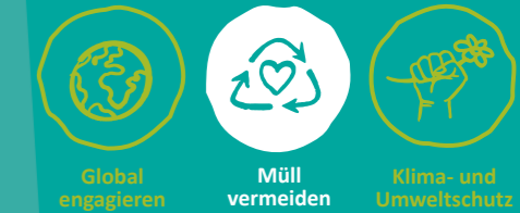
Global engagieren Müll vermeiden Klima- und Umweltschutz

MINDESTALTER DER FREIWILLIGEN: ab 18 Jahren