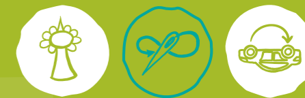
Städtisch Gärtnern Nähwerkstatt, Repair Cafés & Co Verkehr neu denken