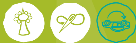
Städtisch Gärtnern Näherwerkstatt, Repair Cafés & Co Verkehr neu denken