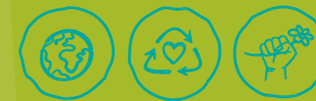
Global engagieren Müll vermeiden Klima- und Umweltschutz

BESONDERE KENNTNISSE UND FÄHIGKEITEN: keine