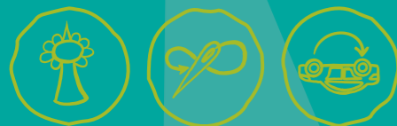
Städtisch Gärtnern Näherwerkstatt, Repair Cafés & Co Verkehr neu denken