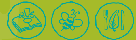
Umweltwissen sammeln Artenvielfalt-Tiere schützen Nachhaltige Ernährung