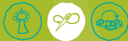
Städtisch Gärtnern Näherwerkstatt, Repair Cafés & Co Verkehr neu denken