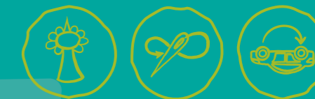
Städtisch Gärtnern Näherwerkstatt, Repair Cafés & Co Verkehr neu denken