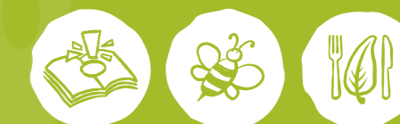
Umweltwissen sammeln Artenvielfalt-Tiere schützen Nachhaltige Ernährung