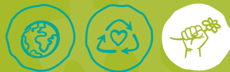
Global engagieren Müll vermeiden Klima- und Umweltschutz

MINDESTALTER DER FREIWILLIGEN: ab 16 Jahren