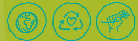
Global engagieren Müll vermeiden Klima- und Umweltschutz

MINDESTALTER DER FREIWILLIGEN: ab 18 Jahren