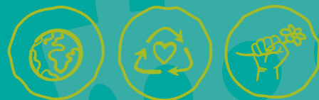
Global engagieren Müll vermeiden Klima- und Umweltschutz

MINDESTALTER DER FREIWILLIGEN: ab 18 Jahren