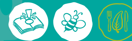
Umweltwissen sammeln Artenvielfalt-Tiere schützen Nachhaltige Ernährung