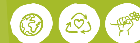
Global engagieren Müll vermeiden Klima- und Umweltschutz