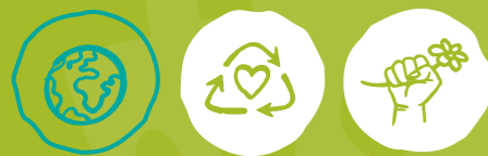
Global engagieren Müll vermeiden Klima- und Umweltschutz