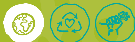
Global engagieren Müll vermeiden Klima- und Umweltschutz

MINDESTALTER DER FREIWILLIGEN: ab 18 Jahren