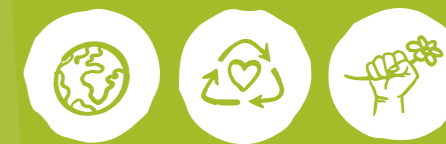
Global engagieren Müll vermeiden Klima- und Umweltschutz