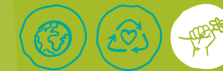
Global engagieren Müll vermeiden Klima- und Umweltschutz

BESONDERE KENNTNISSE UND FÄHIGKEITEN: keine