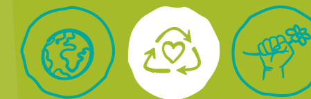
Global engagieren Müll vermeiden Klima- und Umweltschutz