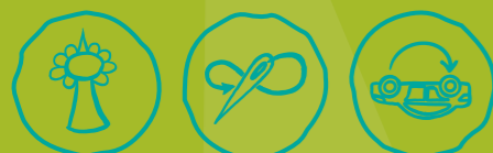
Städtisch Gärtnern Näherwerkstatt, Repair Cafés & Co Verkehr neu denken