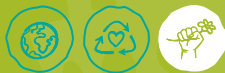
Global engagieren Müll vermeiden Klima- und Umweltschutz

MINDESTALTER DER FREIWILLIGEN: ab 16 Jahren