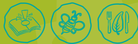
Umweltwissen sammeln Artenvielfalt-Tiere schützen Nachhaltige Ernährung