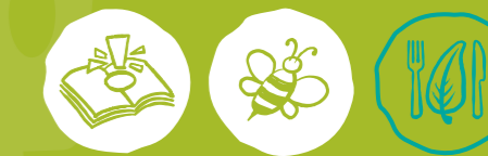
Umweltwissen sammeln Artenvielfalt-Tiere schützen Nachhaltige Ernährung