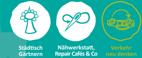
Städtisch Gärtnern Näherkstatt, Repair Cafés & Co Verkehr neu denken