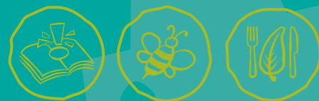
Umweltwissen sammeln Artenvielfalt-Tiere schützen Nachhaltige Ernährung