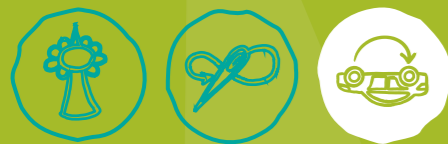
Städtisch Gärtnern Näherwerkstatt, Repair Cafés & Co Verkehr neu denken