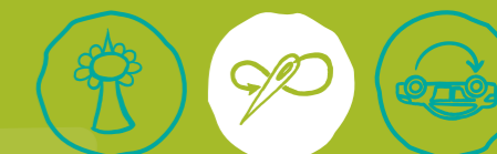
Städtisch Gärtnern Näherwerkstatt, Repair Cafés & Co Verkehr neu denken