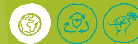
Global engagieren Müll vermeiden Klima- und Umweltschutz

MINDESTALTER DER FREIWILLIGEN: ab 15 Jahren