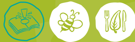
Umweltwissen sammeln Artenvielfalt-Tiere schützen Nachhaltige Ernährung