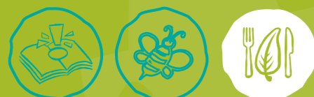
Umweltwissen sammeln Artenvielfalt-Tiere schützen Nachhaltige Ernährung