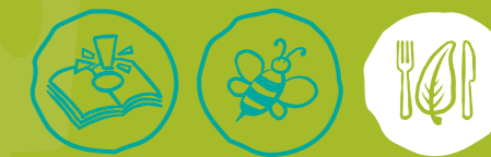
Umweltwissen sammeln Artenvielfalt-Tiere schützen Nachhaltige Ernährung