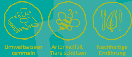
Umweltwissen sammeln Artenvielfalt-Tiere schützen Nachhaltige Ernährung