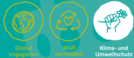
Global engagieren Müll vermeiden Klima- und Umweltschutz

MINDESTALTER DER FREIWILLIGEN: ab 16 Jahren