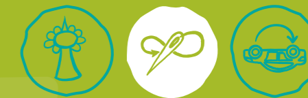
Städtisch Gärtnern Näherwerkstatt, Repair Cafés & Co Verkehr neu denken