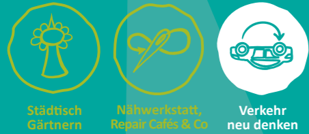
Städtisch Gärtnern Näherkstatt, Repair Cafés & Co Verkehr neu denken