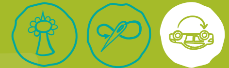
Städtisch Gärtnern Näherwerkstatt, Repair Cafés & Co Verkehr neu denken