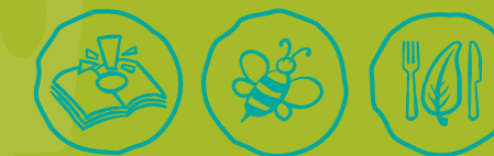
Umweltwissen sammeln Artenvielfalt-Tiere schützen Nachhaltige Ernährung